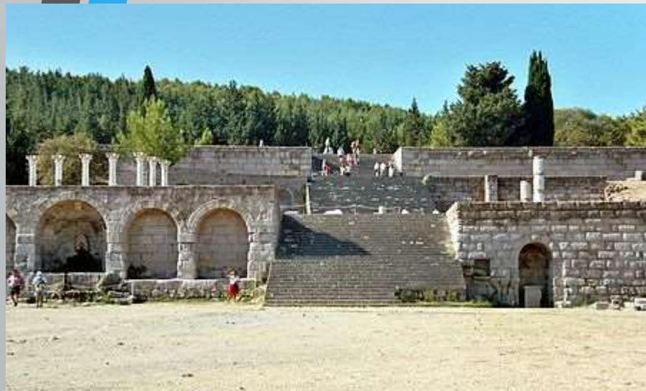
Το Ασκληπιείο στην Κω