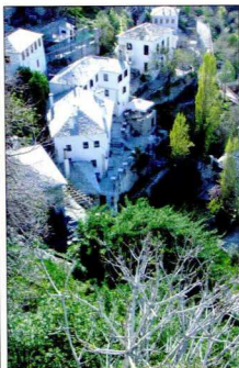
3a-γ. Μακρινότητα Πηλίου. Η πρώτη φωτογραφία είναι χωρίς φίλτρο, η δεύτερη με φίλτρο #89B και η επόμενη είναι η δεύτερη από την οποία απλά έχει αφαιρεθεί το χρώμα.