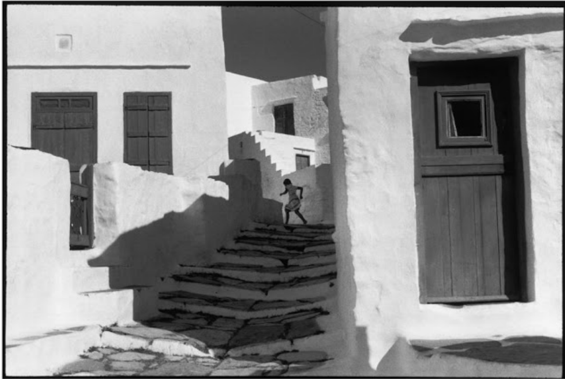
Η διάσημη φωτογραφία στο Κάστρο της Σίφνου