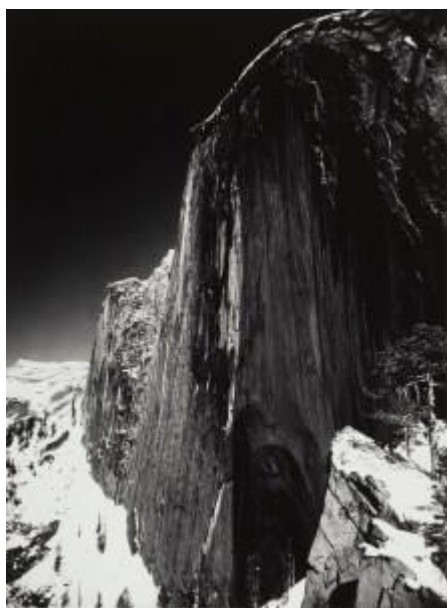
Monolith, The Face of Half Dome, 1927 από τον Ansel Adams

Δεκαεννέα είκοσι επτά ήταν το κομβικό έτος της ζωής του Άνταμς. Έκανε την πρώτη του πλήρως οπτικοποιημένη φωτογραφία, Monolith, the Face of Half Dome , και πήρε το πρώτο του HighTrip. Το πιο σημαντικό, ήταν ότι επηρεάστηκε από τον Άλμπερτ Μ. Μπέντερ, ασφαλιστικό μεγιστάνα του Σαν Φρανσίσκο και προστάτη των τεχνών και των καλλιτεχνών. Κυριολεκτικά την επομένη της συνάντησής τους, ο Bender ξεκίνησε την προετοιμασία και τη δημοσίευση του πρώτου χαρτοφυλακίου του Adams, Parmelian Prints of the High Sierras [sic].