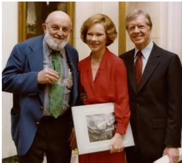
"Ansel με τον Jimmy και Rosalynn Carter με το Yosemite Book", 11/6/79 (δεξιά)

Μεγάλωσε σε μια εποχή και τόπο όπου ο ζεϊγκίστας του σχηματίστηκε από την προεδρία του Θεόδωρου Ρούσβελτ και τον «μυώδη» αμερικανισμό, από τη διαδεδομένη αίσθηση του προφανούς πεπρωμένου και την αντίληψη ότι ο ευρωπαϊκός πολιτισμός επανεφευρέθηκε - πολύ προς το καλύτερο - στην νέο έθνος και, ιδιαίτερα, στη νέα Δύση. Ο Άνταμς πέθανε στο Μοντερέι, Καλιφόρνια.