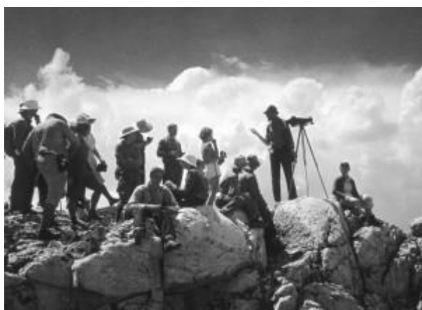
Άνσελ Άνταμς, Κήρυγμα στο Όρος

Η υπερκινητική ύπαρξή του τροφοδοτήθηκε επίσης από το αλκοόλ, για το οποίο είχε ιδιαίτερη αγάπη και μια συνεχή δίνη κοινωνικής δραστηριότητας, φίλων και συναδέλφων. Όπως γράφει ο Beaumont Newhall στο FOCUS: Memoirs of a Life in Photography (1993), «ο Ansel ήταν ένας σπουδαίος άνδρας του πάρτι και του άρεσε να διασκεδάσει. Είχε μια πολύ κυρίαρχη προσωπικότητα και θα ήταν πάντα το κέντρο της προσοχής» (σελ. 235).