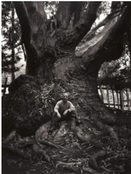
Edward Weston από τον Ansel Adams

Τεχνικές όπως «κάψιμο» και «αποφυγή», καθώς και το Zone System, ένα επιστημονικό σύστημα που αναπτύχθηκε από τον Adams, χρησιμοποιείται ειδικά για να «χειριστεί» την τονικότητα και να δώσει στον καλλιτέχνη τη δυνατότητα να δημιουργεί σε αντίθεση με το δίσκο.]