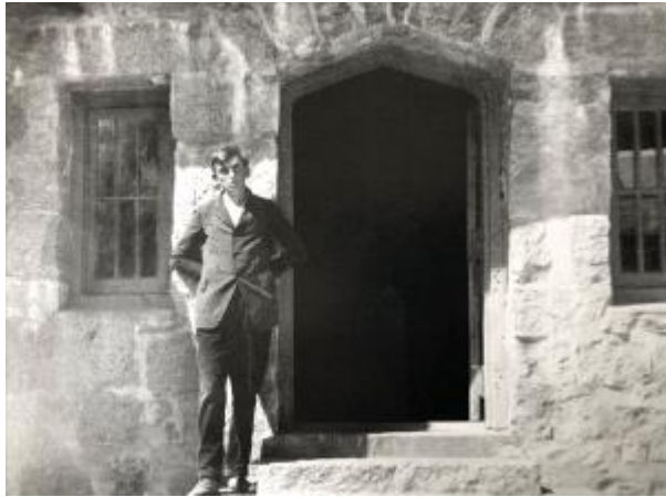
Ansel στο LeConte Lodge, Yosemite Valley, Καλιφόρνια, γ. 1921.

Εάν η αγάπη του Άνταμς για τη φύση καλλιεργήθηκε στη Γκόλντεν Γκέιτ, η ζωή του ήταν, σύμφωνα με τα λόγια του, «χρωματισμένη και διαμορφωμένη από τη μεγάλη κίνηση της γης» της Γιόσεμιτ Σιέρα (Άνταμς, Γιόσεμιτ και η Σιέρα Νεβάδα, σελ. Χίβ). Πέρασε σημαντικό χρόνο εκεί κάθε χρόνο από το 1916 μέχρι το θάνατό του. Από την πρώτη του επίσκεψη, ο Άνταμς μεταμορφώθηκε.